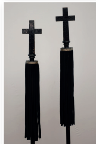
Marskalkstaver, Jevnaker kirke (øverst) og Randsfjord kirke (nederst).