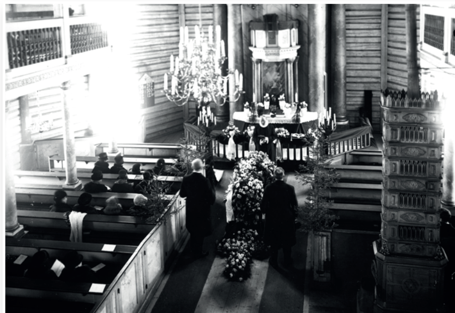
Under: Gravferd fra Jevnaker kirke, med marskalker som æresvakter ved kista. Foto: HF1985/22:243 Foto: Nielsen, Arthur / Randsfjordmuseet