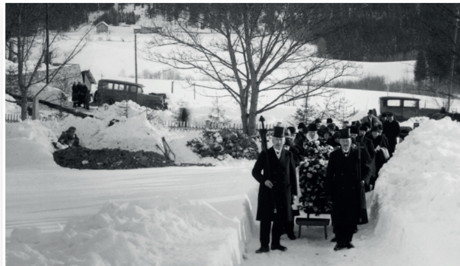
Over: Gravferd fra Jevnaker kirke, med marskalker først i gravfølget. Foto: HF1985/22:240 Foto: Nielsen, Arthur / Randsfjordmuseet (utsnitt)